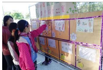
義賣品 LOGO 設計完成 後舉行全校票選活動