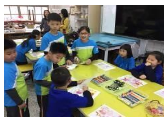
偏鄉交流活動-擔任熱縮片鑰匙圈小老師