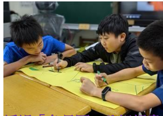
透過「魚骨圖」分組規畫任務分配