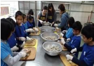
偏鄉交流活動-廚房洗菜義煮