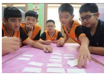
偏鄉交流活動-教偏鄉學生玩桌遊