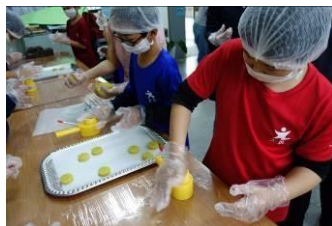
綠豆糕製作分工合作完 成作品