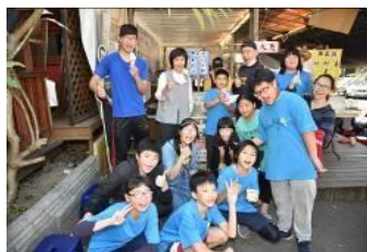
義賣經費捐助義煮