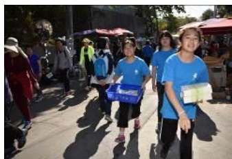
9 號步道綠豆糕義賣受