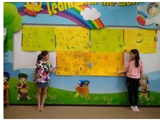
學生進行 5W 圖偏鄉共學交流企劃書