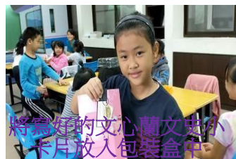
將寫好的文心蘭文史小 卡片放入包裝盒中