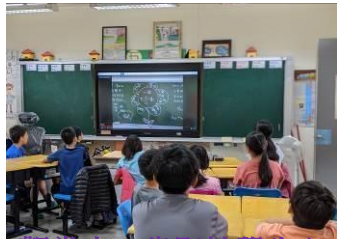
觀賞十二歲影片學生心得發表

任務分配-組將所完成的企畫書張貼在黑板上，老師引導各組學生發表並進行工作事項歸納與統整並完成義賣任務分配。