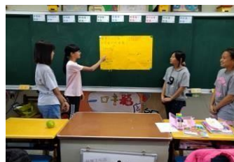
分享義賣的困難與感