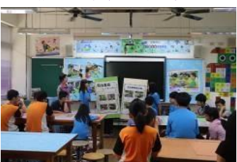
偏鄉交流活動-說魚丸伯的故事