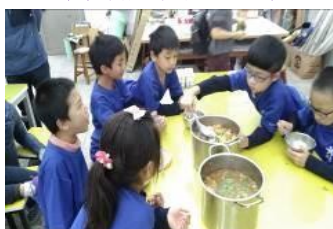
偏鄉交流活動-陪伴午餐