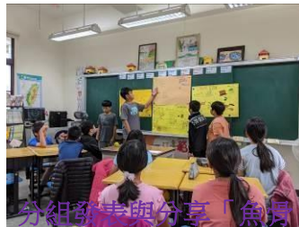
分組發表與分享「魚骨圖」成果