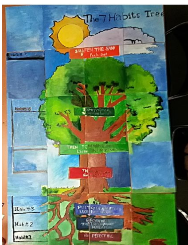
創作者:701 全體同學 題目:七個好習慣樹 設置地點:泰鼎禮堂

創作理念: 我覺得我們符合了主動積極的習慣,養成好品格,創作出好作品,我希望我們的香水瓶,能美化我們的人生。