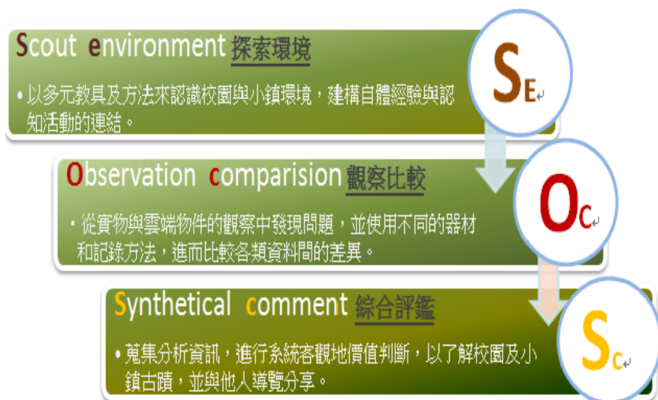
圖 1 「S.O.S 創新教學模式」

結合「S.O.S 創新教學模式」(Scout environment、Observation comparison、Synthetical comment ) (如圖 1) 設計，希望學生能從見證古蹟的轉變中探索歷史脈絡，透過「團隊合作」、「公民力」及「創造力」的培養，能以多元展能的方式傳承文化創新，賦予古蹟不同的時代意義詮釋。