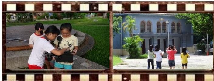
圖 2 學生正敘說著自己與旗山古蹟的學習故事

旗蹟的故事 在【探索歷史脈絡】方面，以旗山在地的人文歷史為核心，包含與旗山古蹟有關的人文故事及歷史傳說，讓學生感受到旗山在地的相關故事。在【見證古蹟轉變】中，古蹟本身就是一本見證歷史的書，學生從認識古蹟開始探索她的過去、現在及未來的規劃，提升整理、歸納、分析、綜合評鑑能力。在【傳承文化創新】方面，協助學生發展屬於自己旗山社區的理解與詮釋，發展屬於旗山國小學童的跨時代故事，並以導覽無界的創意分享方式進行文化創新傳承。