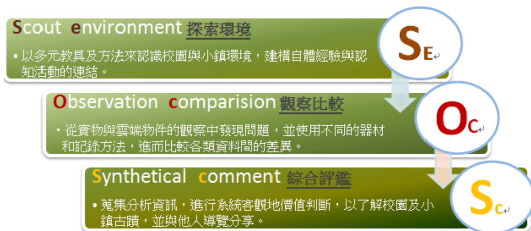
圖 1 「S.O.S 創新教學模式」

我們希望校園古蹟課程透過空間環境、多元教具運用的輔助，達成學生實踐文化踏查、感受文化體驗等教學目標。本校希望依據各自先備能力及學習廣角的不同，讓學生學習在校園古蹟及新校舍之間 探索環境 (Scout environment)，在歷史故事及現代情節之間 觀察比較 (Observation comparision)，在探究脈絡及創造未來之間 綜合評鑑 (Synthetical comment)（如圖 1），透過校園古蹟的親身體驗、實地踏查，藉由校園古蹟的學習歷程，整理、歸納、分析、發展屬於旗山國小學童的跨時代故事。