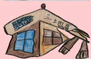
舊三塊厝火車站之學生畫作