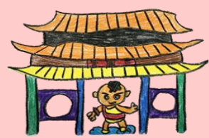
三鳳宮之學生畫作