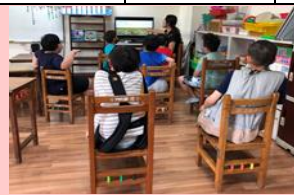
探訪三鳳中街的歷史