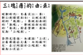
介紹三塊厝的由來