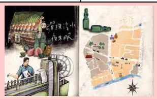
彈珠汽水夜未眠故事