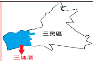
學生塗出三塊厝的位置