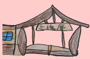
新三塊厝火車站之學生畫作