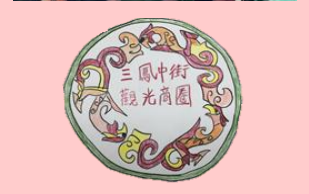
三鳳中街觀光商圈之學生畫作