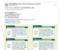
金車文教基金會在臉書上分享「減碳大作戰」活動紀錄