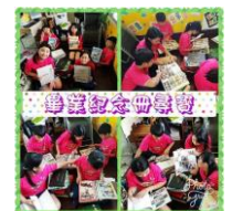
向學校教務處借歷屆畢業紀念冊，找尋老榕樹照片