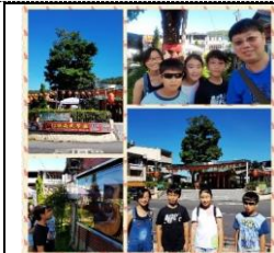
走訪大坑圓環老茄苳