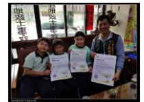
拜訪水景里里長在里民公布欄和臉書張貼活動海報