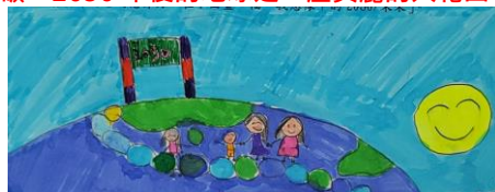
確認「最佳情境分析」

所有人類無時無刻在日常生活中做好節能減碳，2030 年後的地球是一座美麗的大花園。