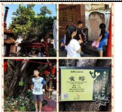
走訪軍功福德祠老雀榕