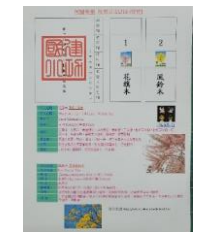
學校印發樹種的基本資料，製作選票以民主參與的方式決定種植樹種