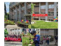
植樹節進行全校性的種植樹木活動