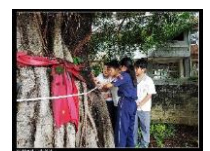
拿著皮尺實際測量大榕樹的樹圍