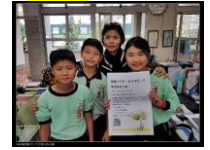
請學務處老師協助在校內張貼領取樹苗活動海報