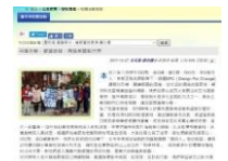
臺中市政府教育局網站「臺中市校園活動報導」之報導