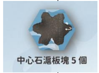
中心石滬板塊 5 個