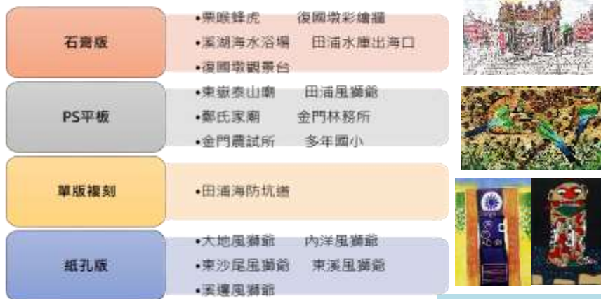
◎學生景點創作作品